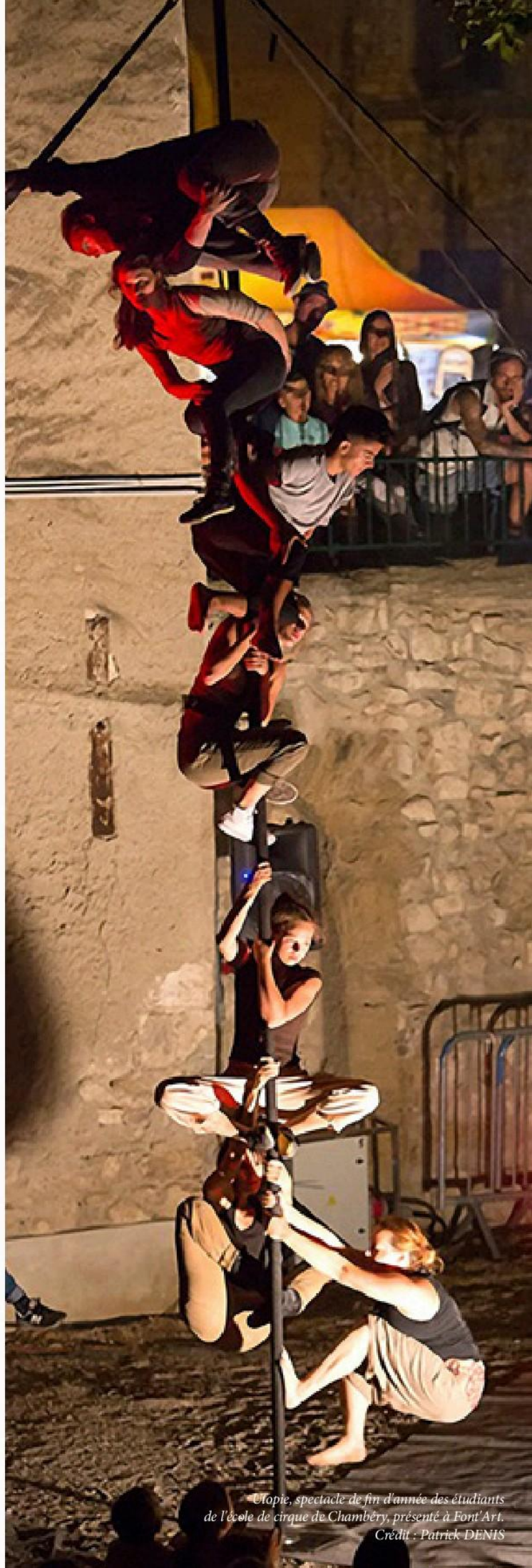
Utopie, spectacle de fin d'année des étudiants de l'école de cirque de Chambéry, présenté à Font'Art.

Les tarifs présentés dans ce catalogue sont Toutes Taxes Comprises. Il convient d'y ajouter parfois une TVA à taux réduit (5,5 %) ainsi que les défraiements (frais de déplacement, repas et hébergement des artistes et accompagnants). Il est primordial, pour que le séjour de la compagnie se passe le mieux possible, de bien discuter avec elle de ce point afin de trouver la solution la plus adaptée. De même, discutez précisément avec la compagnie de tout matériel technique spécifique nécessaire. Enfin, n'oubliez pas de prévoir le paiement des éventuels droits d'auteurs (SACD, SACEM, autres...).