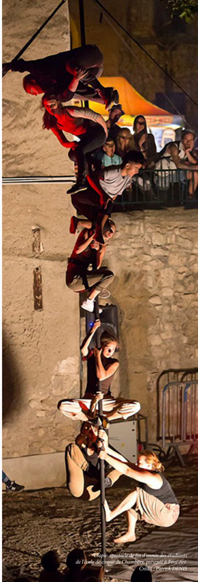
Utopie, spectacle de fin d'année des étudiants de l'école de cirque de Chambéry, présenté à Font'Art.

Les tarifs présentés dans ce catalogue sont Toutes Taxes Comprises. Il convient d'y ajouter parfois une TVA à taux réduit (5,5 %) ainsi que les défraiements (frais de déplacement, repas et hébergement des artistes et accompagnants). Il est primordial, pour que le séjour de la compagnie se passe le mieux possible, de bien discuter avec elle de ce point afin de trouver la solution la plus adaptée. De même, discutez précisément avec la compagnie de tout matériel technique spécifique nécessaire. Enfin, n'oubliez pas de prévoir le paiement des éventuels droits d'auteurs (SACD, SACEM, autres...).